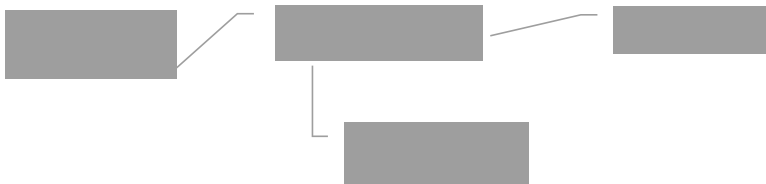
Figura 1. Pasos para solicitar una beca. Tomado de Rodríguez (2012).