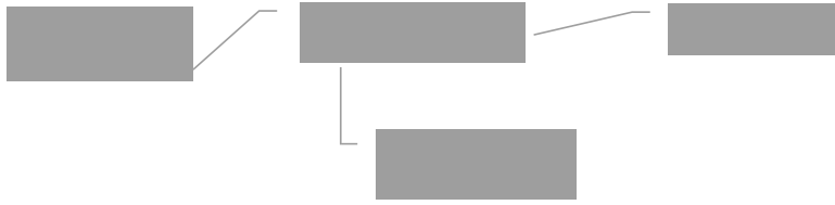
Figura 2. Pasos para solicitar una beca. Elaboración propia.